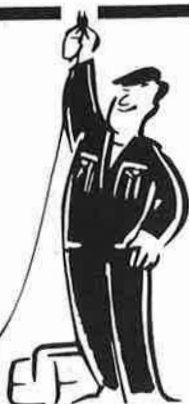
ABB Din elektriker

Tlf.: 72 48 04 55 Fax: 72 48 13 20 7300 ORKANGER