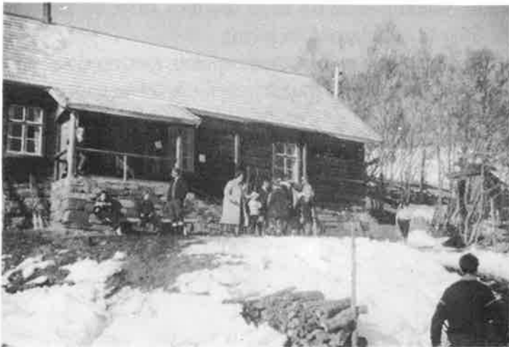
Bilder av publikum fra skjærtorsdag under rennet ca. 1965 ved Monsethuset.

Det blev da i den anledning oppnevnt en arrangementskomite til å ta seg av saken og få rennet avviklet på beste måte».