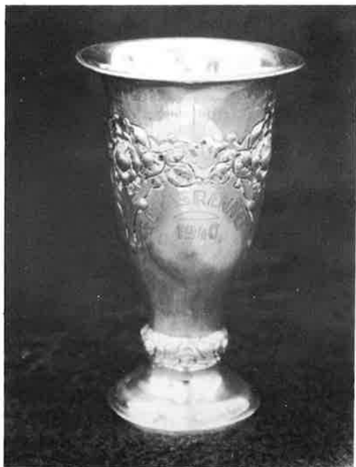
Bestemannspokal opsatt fra 1940